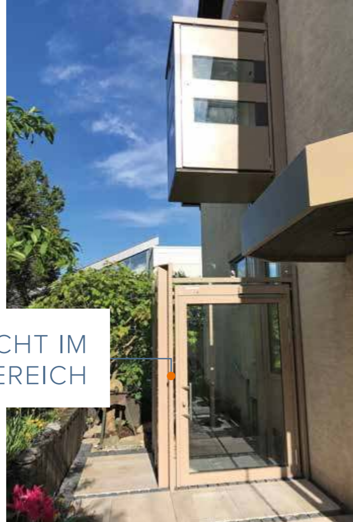
SCHACHT IM LANDEBEREICH