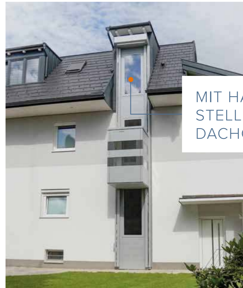
MIT HALTE- STELLE IM DACHGESCHOSS