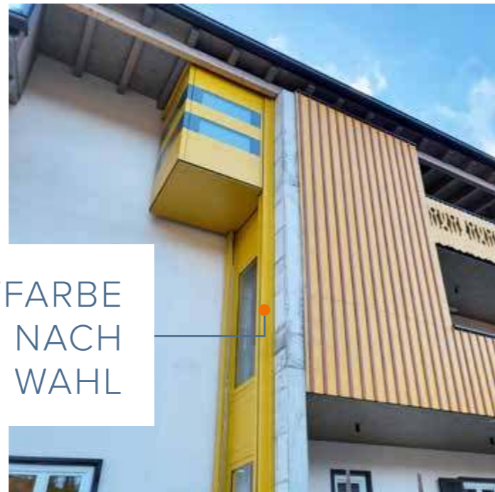
LIFTFARBE IN RAL NACH WAHL

mehr dazu auf unserer Webseite quattroporte.at